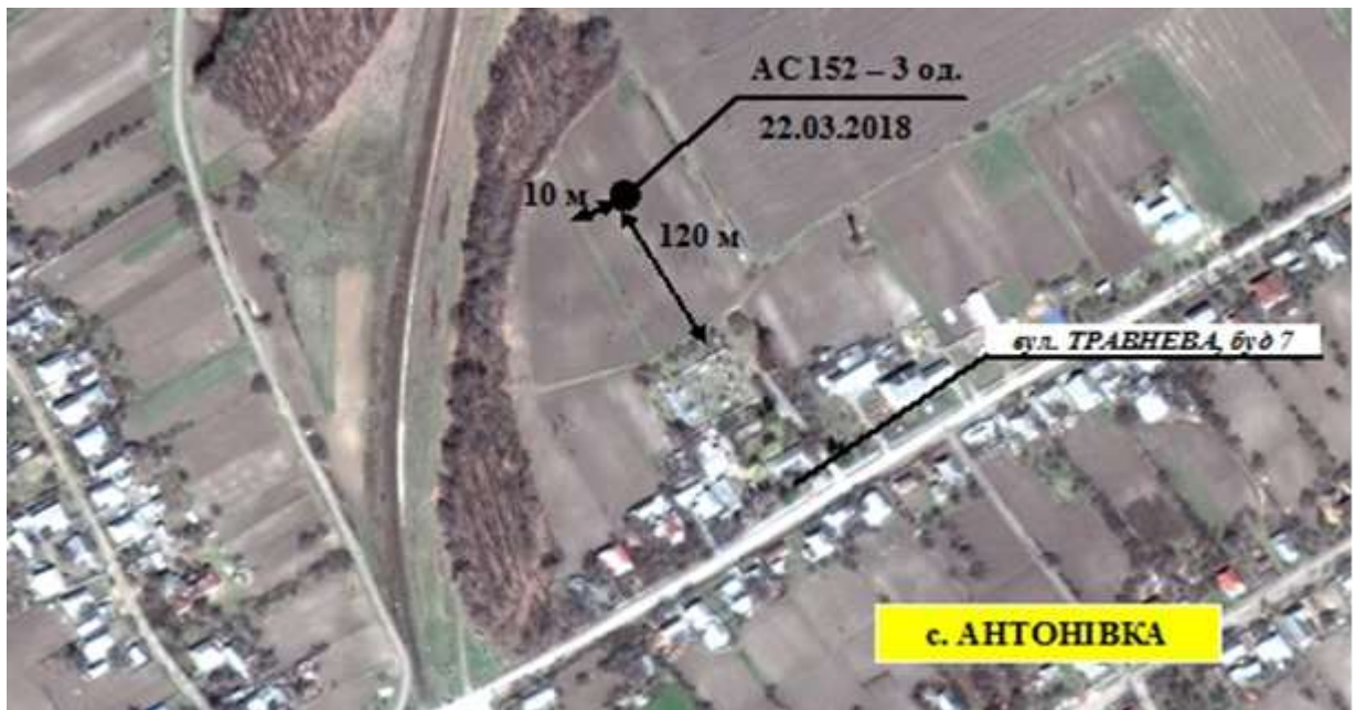
СХЕМА місця виявлення вибухонебезпечного предмета