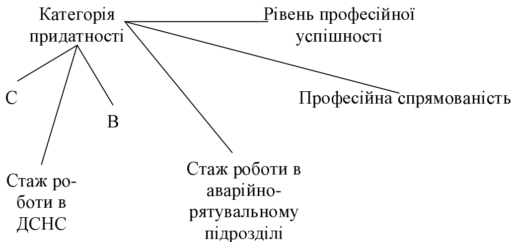
Рис. 1 □ Кореляційна структура компонентів, що визначають категорію придатності фахівця аварійно-рятувального підрозділу до дій в екстремальній ситуації

характеризує рівень емоційної стійкості особистості. Також було виділено позитивний, помірний за силою, кореляційний зв'язок з фактором «В» ( r=0,35, p \leq 0,05 ), який свідчить про інтелектуальні особливості фахівця.