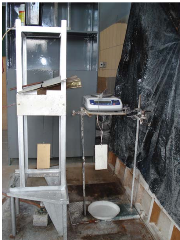
Рисунок 1 – Общий вид лабораторной установки для определения времени повторного воспламенения

ваются весы непрерывного взвешивания ТНВ–600 (точность взвешивания – 0,01 г, время реакции весов на изменение массы – 1,5 с). На этих весах подвешивается контрольный образец бруска древесины, так чтобы он располагался на расстоянии 25 см от исследуемого образца и находился на одном с ним уровне. Внешний вид лабораторной установки для определения времени повторного воспламенения приведён на рис. 1.