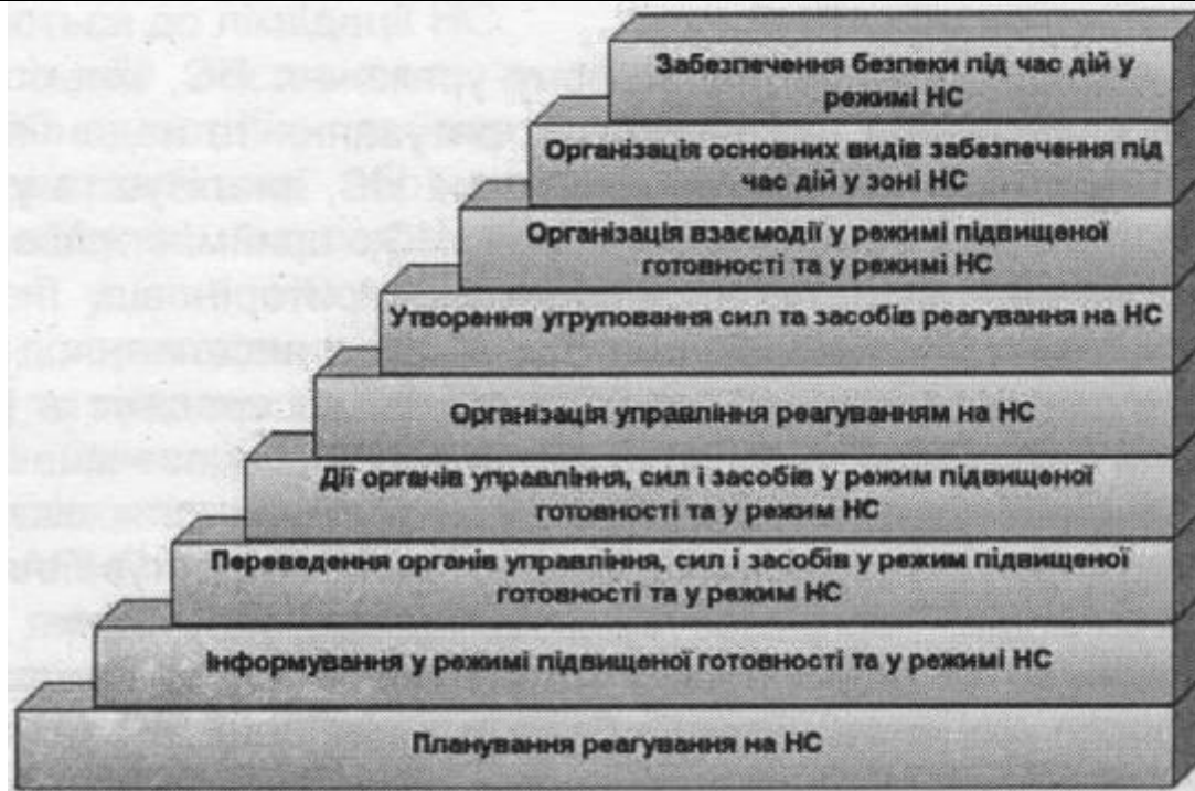
Рис.3. Алгоритм оперативного реагування на НС