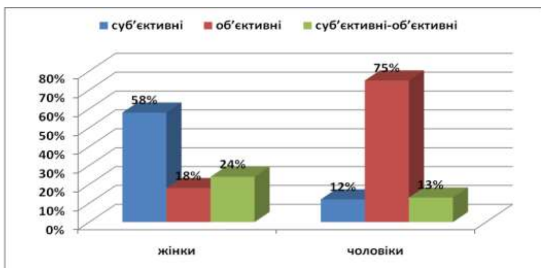
Рис. 1 Причини важливості кар'єри

Незважаючи на те, що і чоловіки і жінки, в рівній мірі відзначають важливість кар'єри в житті людини, проте вони наводять різні пояснення, чому саме кар'єрне зростання є таким важливим. На рис. 1 представлено порівняння відповідей цих чоловіків і жінок на запитання про причини важливості кар'єри в житті людини.