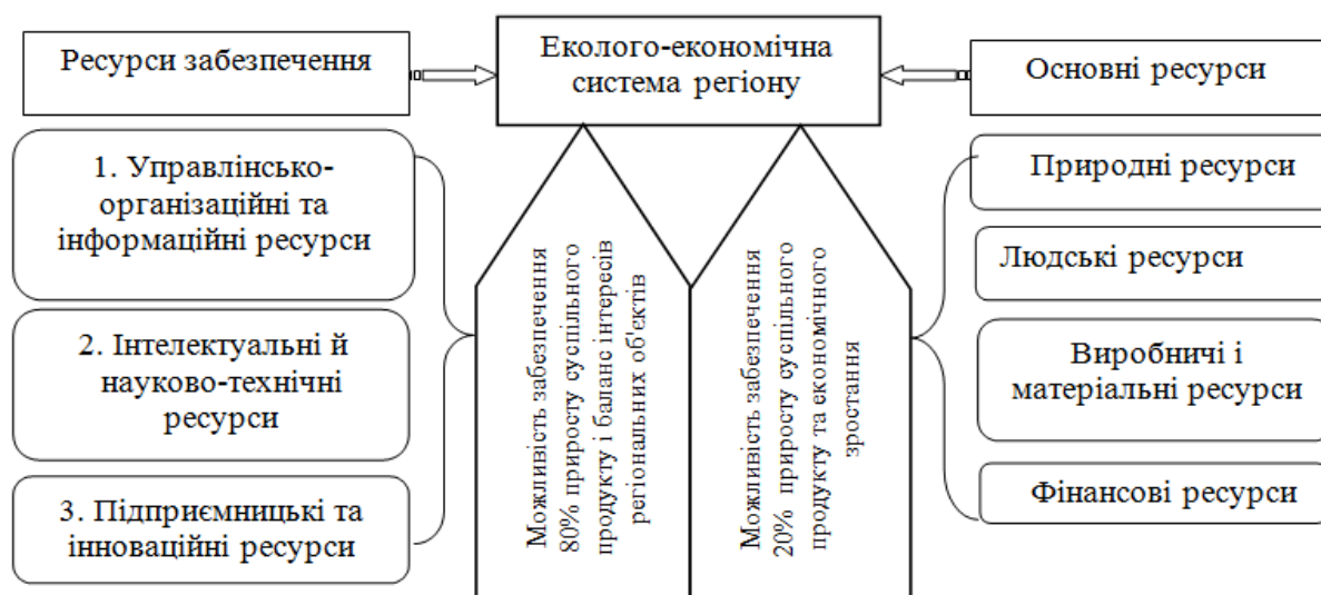
Рис. 1. Класифікація ресурсів еколого-економічного розвитку регіону

Також в процесі реалізації концепції регіонального еколого-економічного розвитку слід враховувати й національні особливості. Враховуючи те, що Україна у найближчій перспективі не може повністю відмовитися від розвитку сировинного комплексу і гостро потребує не лише стабілізації темпів економічного зростання, але й їх прискорення, наразі особливо актуальним є освоєння жорстких екологічних стандартів промислово розвинених країн [2].