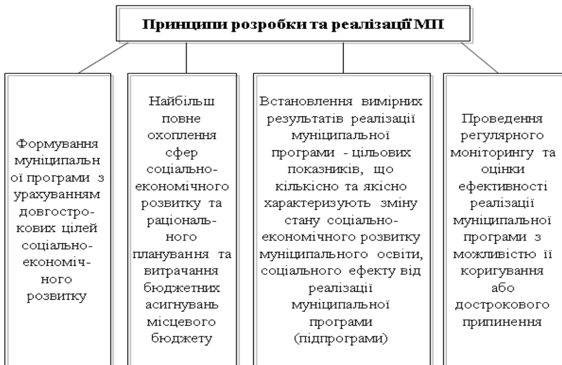
Рис. 2. Принципи розробки та реалізації програм соціально-економічного розвитку територій.

Соціально-економічне становище регіонів України відрізняється одне від одного, що зумовлено їх диференціацією по географічному положенню, наявними можливостями для нарощування економічного потенціалу, забезпечення комфортного довкілля для мешканців.