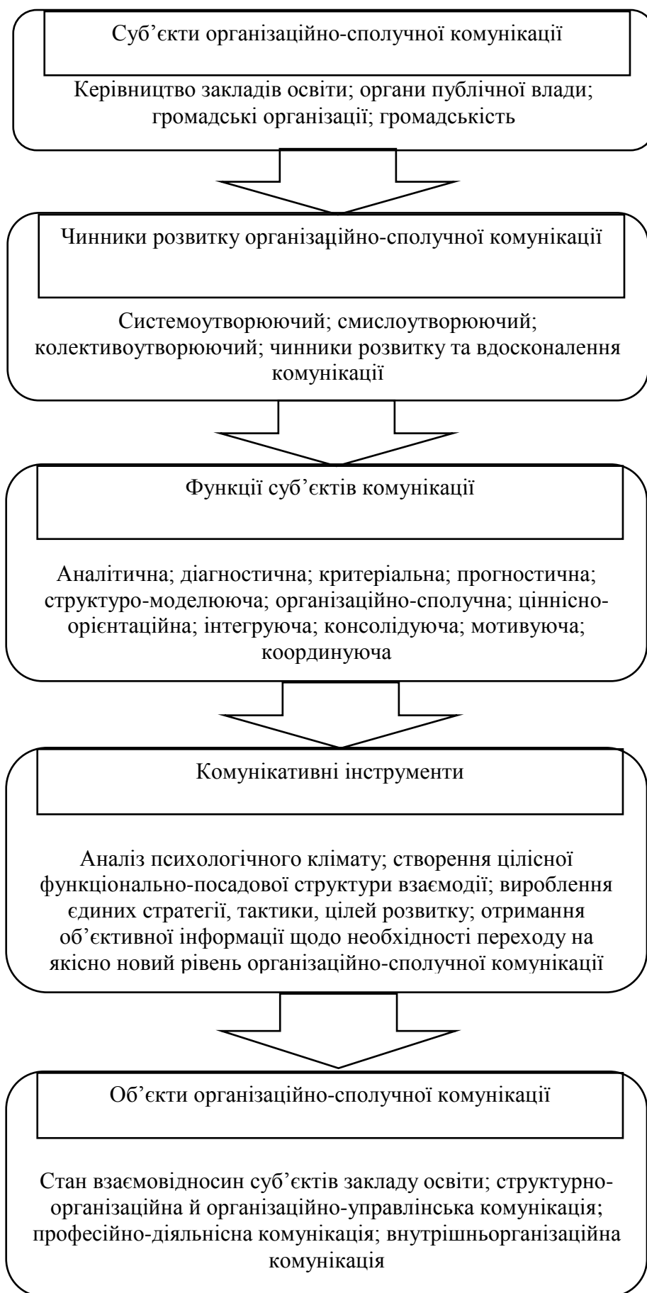
Рис. 2. Механізм публічного управління організаційно-сполучними комунікаціями у сфері освіти