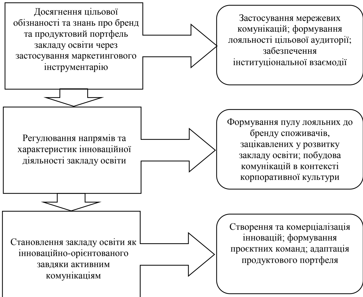
Рис. 3. Механізм публічного управління інноваційним розвитком закладу освіти на основі системної реалізації інтегрованих комунікацій

Запропоновано механізм публічного управління інноваційним розвитком закладу освіти на основі системної реалізації інтегрованих комунікацій (рисунок 3).