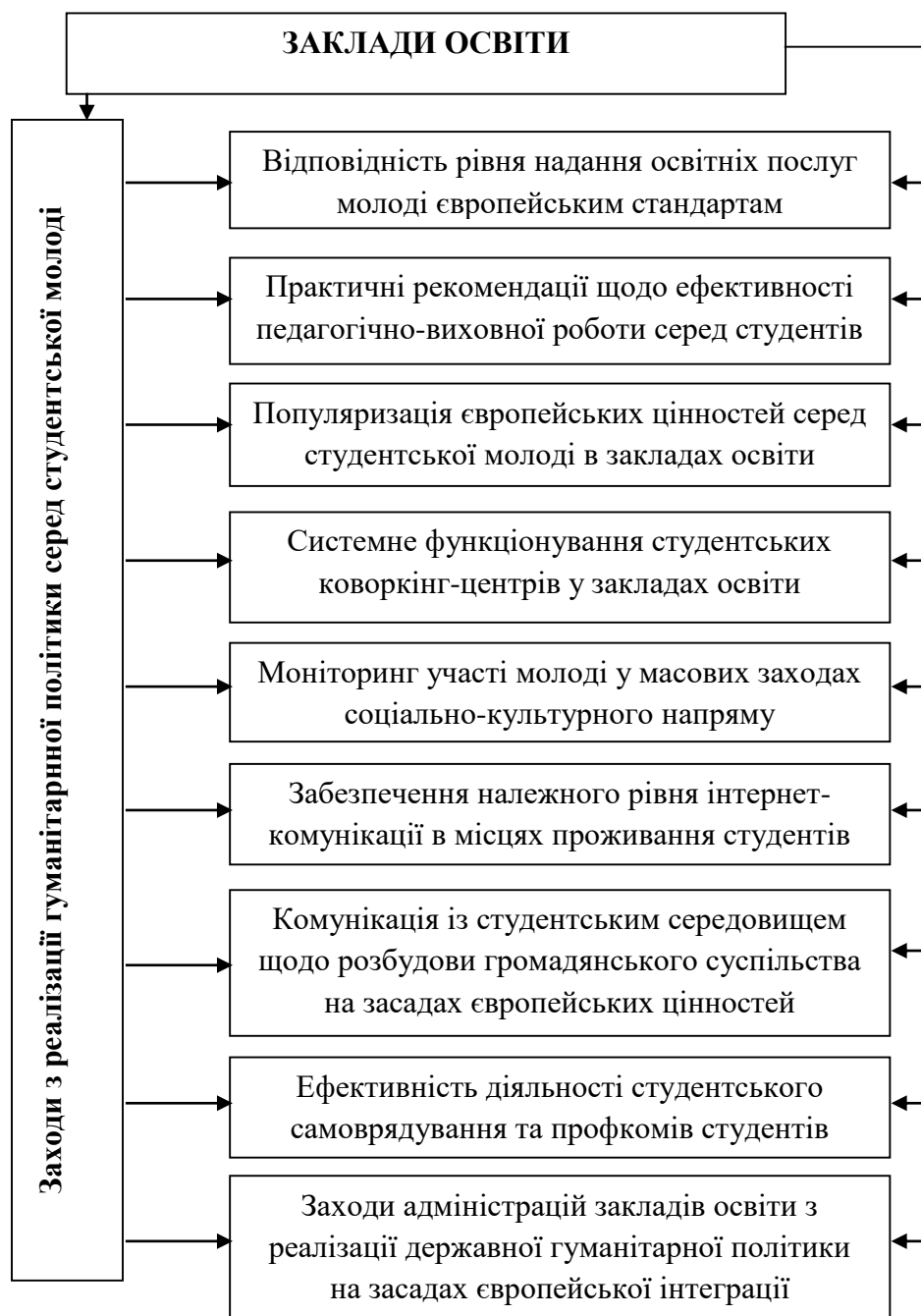
Рис. 1. Реалізація державної гуманітарної політики у закладах освіти серед студентської молоді з популяризації європейських цінностей

Освітні інновації відіграють вирішальну роль у підтримці гуманітарної згуртованості, соціально-економічного зростання, глобальної конкурентоспроможності. Зважаючи на прагнення європейської спільноти до створення міцного фундаменту знань, вища освіта є суттєвим компонентом соціально-культурного розвитку, водночас зростаючий попит на навички та компетенції ставить перед вищою освітою нові шляхи вирішення завдань. У відповідь на зростаючі очікування система вищої школи має здійснити кардинальне зрушення у наданні освітніх послуг.