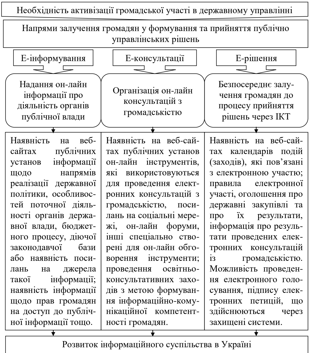
Рис. 2. Напрями залучення громадянського суспільства у процес формування та прийняття державно управлінських рішень за допомогою інформаційно-комунікаційних технологій (ІКТ)