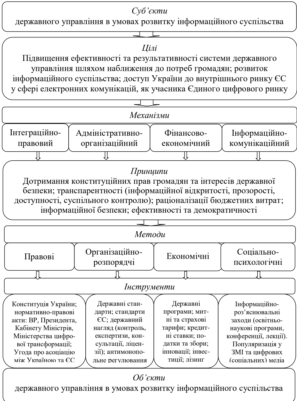
Рис. 1. Механізми державного управління в умовах розвитку інформаційного суспільства