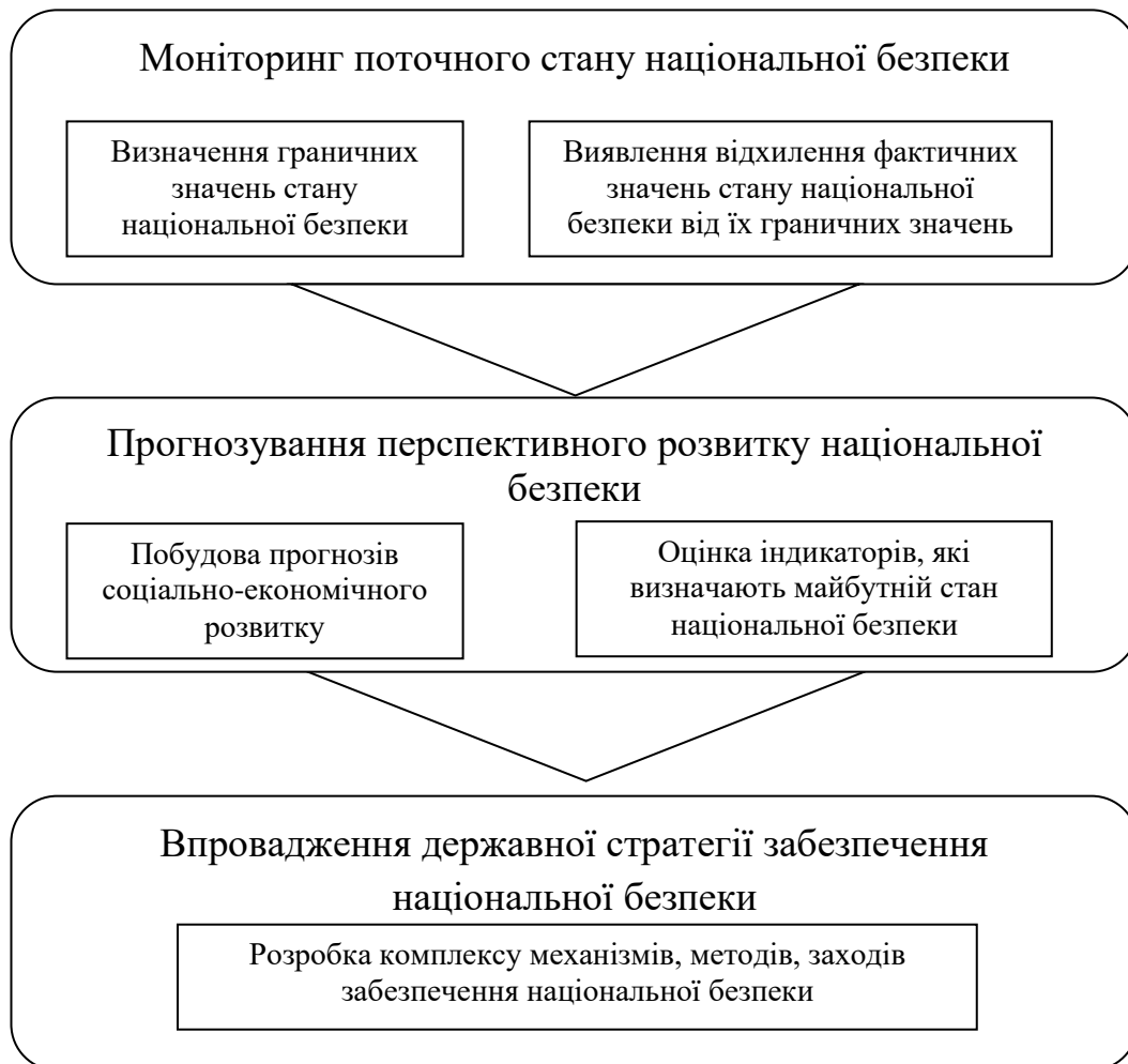
Рис. 1. Послідовність етапів впровадження стратегії забезпечення національної безпеки України

перспективного розвитку національної безпеки та впровадження державної стратегії забезпечення національної безпеки (рис. 1).