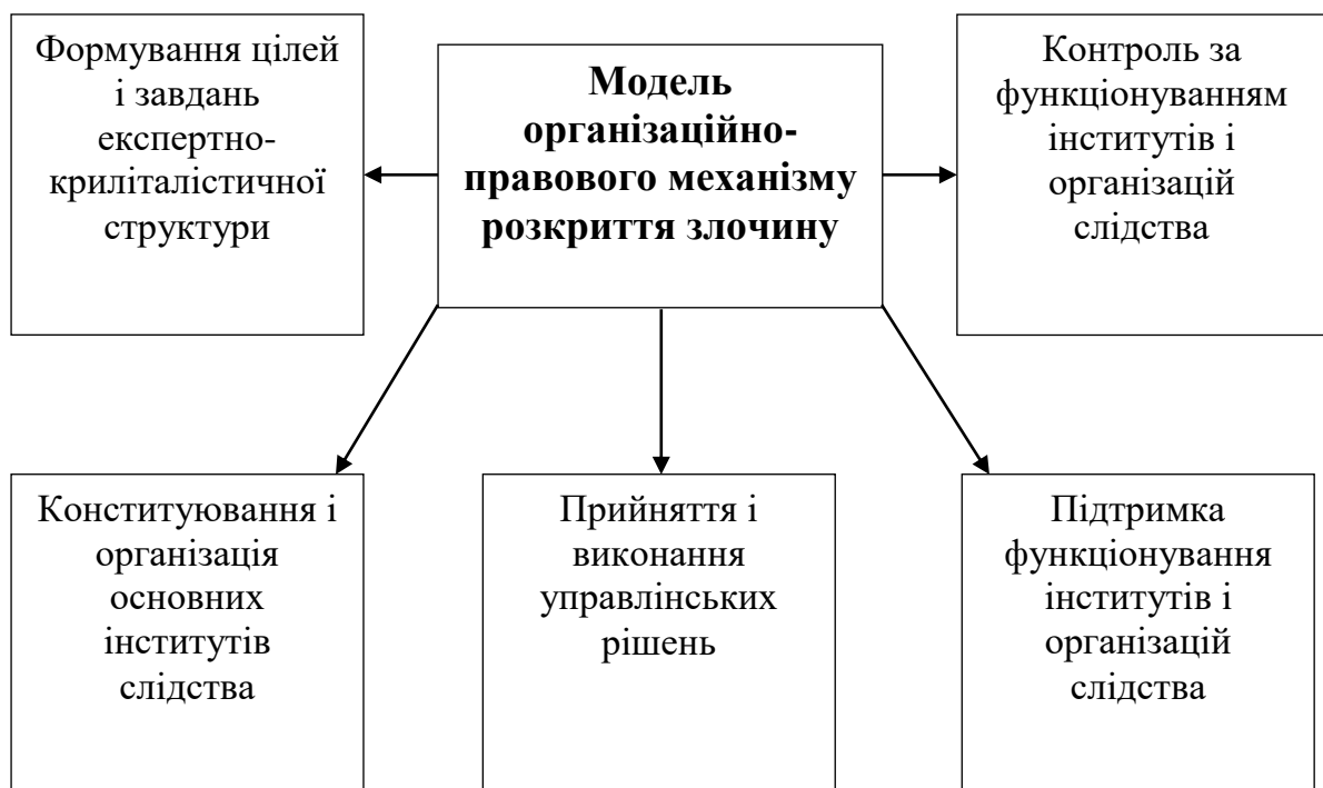
Рис.2 . Модель організаційно-правового механізму розкриття злочину*