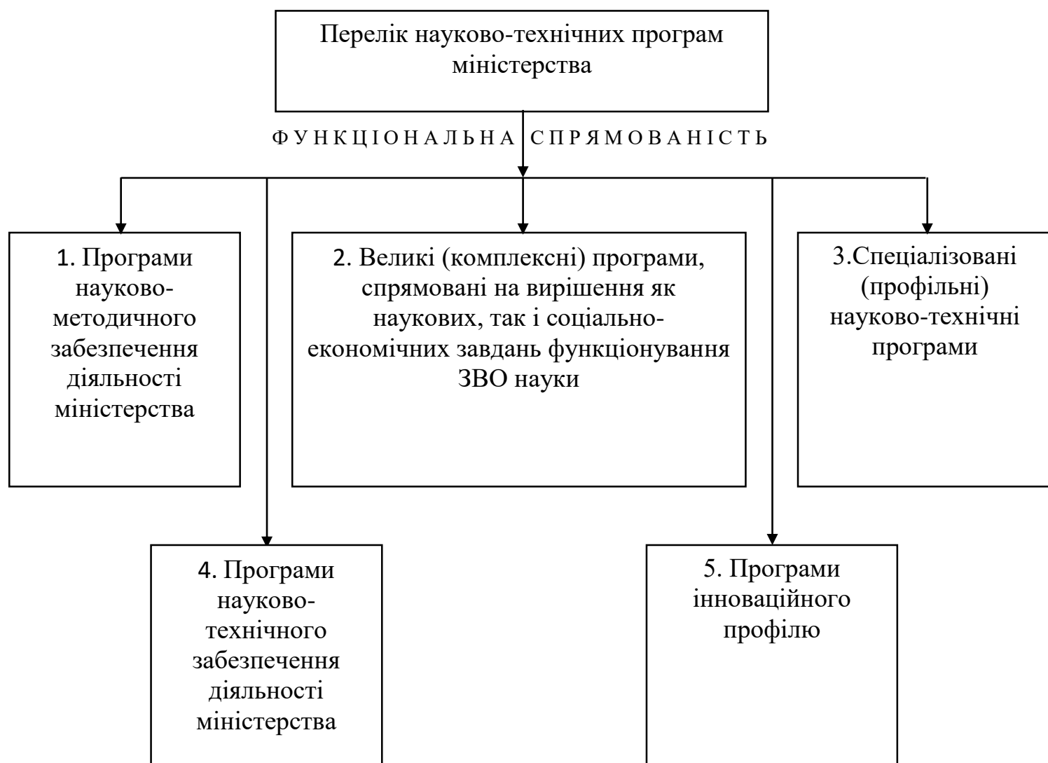
Рис. 2 Схема науково-технічних програм міністерства