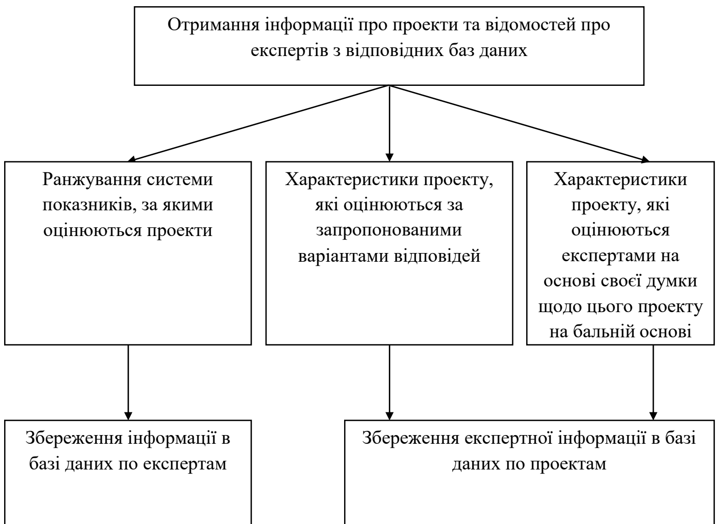
Рис.1 . Схема організації роботи блоку експертизи.

Після оцінки експертом уся інформація заноситься у базу даних, де перебуває оцінюваний проект.