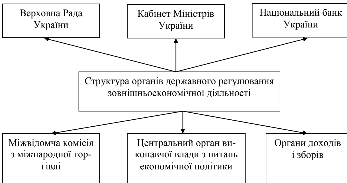
Рис. 3. Структура органів державного регулювання зовнішньо-економічної діяльності

В якості суб'єктів державного регулювання зовнішньоекономічної діяльності виступають наступні: держава; недержавні органи управління економічною діяльністю, що функціонують на основі статутних документів (біржі товарного, фондового та валютного типу, торговельні палати, різнохарактерні спілки й асоціації); безпосередні суб'єкти зовнішньоекономічної діяльності, в якості яких виступають підприємства, організації різних форм власності та сфер діяльності, а також їх об'єднання; органи державного регулювання зовнішньоекономічної діяльності міжрегіонального та міжнародного рівня (Світова організація торгівлі, Генеральна угода з тарифів та торгівлі, Міжнародний валютний фонд, Європейський банк реконструкції та розвитку тощо). Відповідно до ст. 9 "Органи державного регулювання зовнішньоекономічної діяльності" та ст. 10 "Органи місцевого управління зовнішньоекономічною діяльністю" Закону України "Про зовнішньоекономічну діяльність" від 16.04.1991 р. № 959-ХІІ зі змінами та доповненнями, структура зазначеного державно-управлінського апарату містить складові, що показані на рис 3.